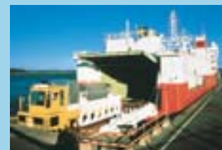
Transportbeholder med brugt reaktorbrændsel