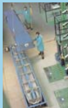
Transportbeholder med nyt uranbrændsel