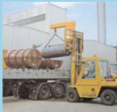
Inder- og yderbeholder for uranhexafluorid